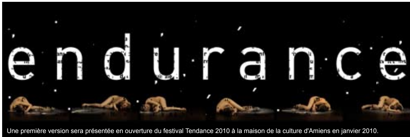
Une première version sera présentée en ouverture du festival Tendance 2010 à la maison de la culture d'Amiens en janvier 2010.

Suite de LOSS-LAYERS , ENDURANCE pourrait se présenter sous trois formes : film, performance et installation. Ces travaux s'élaborent et se complètent continuellement, se nourrissant mutuellement. La structure en quatre parties y est maintenue : l'attente, l'être là, la chute, l'ouverture.