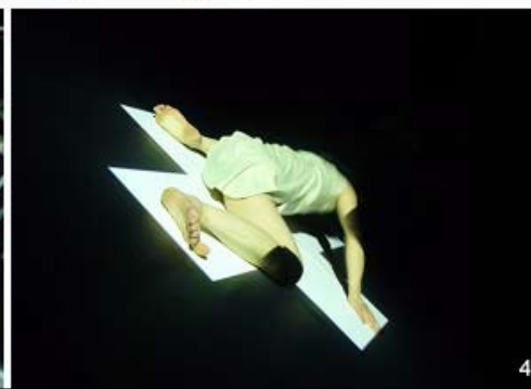
1 - Alarm! 2 - GeeeeeeeK! © Yoshikazu Inoue 3 - E/G © Banri 4 - Loss © C.Attagnant.